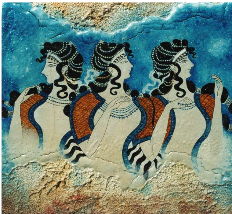
Affreschi del Palazzo di Cnosso.

ora di Fata Turchina, ha sempre la stessa valenza nella tradizione iniziatica: indica il "lunare", vale a dire il sentimento, l'intuizione, l'immaginazione, facoltà che, sole, permettono di accedere alla sfera del metafisico, unica Via che può condurre verso una dimensione superiore, quella dimensione che porta l'Ego a superare in una graduale espansione i propri confini, i propri limiti fino a sentirsi parte dell' anima mundi , fino a confondersi nella Vita cosmica, unica e perenne... ■