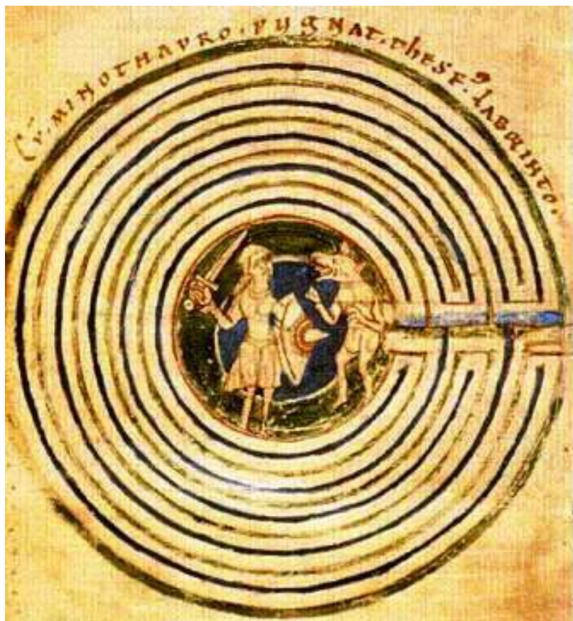
Teseo e il Minotauro.

Quale il significato nell'accezione più profonda?